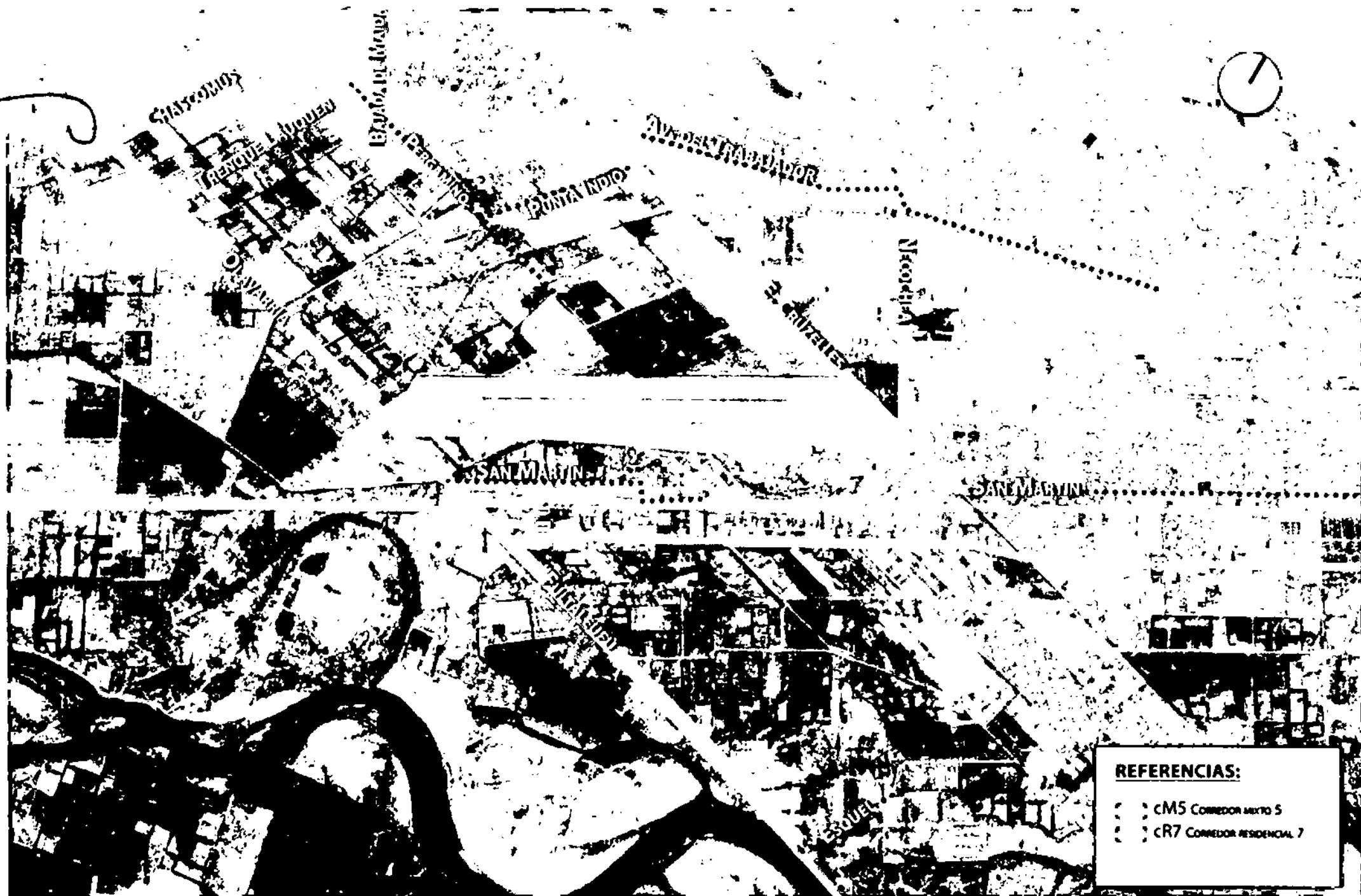
PLANO DE ZONIFICACIÓN - CORREDORES ANEXO IV