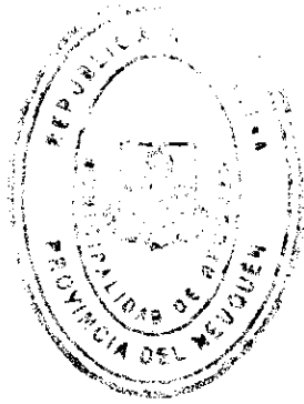
Cr. Mario D. Rimaniol SUBSECRETARÍA DE HACIENDA SECRETARÍA DE ECONOMÍA Y FINANZAS MUNICIPALIDAD DE NEUQUÉN

ARTICULO 4º) REGÍSTRESE, Cúmplase de conformidad, dese al Centro de Documentación información ----- municipal y oportunamente ARCHÍVESE.-