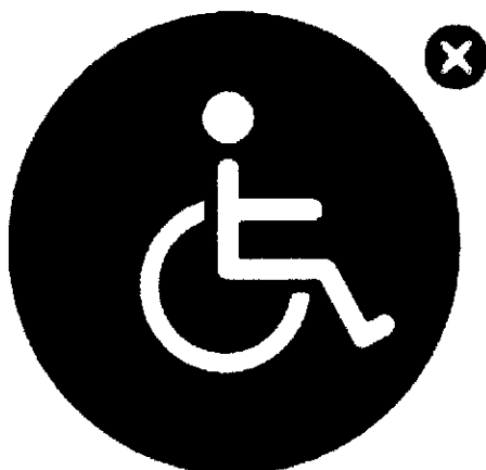
ANTIGUO SÍMBOLO DE "DISCAPACIDAD"

Unidad de Diseño Gráfico Departamento de Información Pública